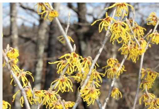
マンサク (アミゼの森) 3月3日撮影

プロリーグ発足から7年が経過し、そのビジネスモデルは右肩上がりの成長を続けてきたことから、多種目の競技関係者はもちろん、スポーツとは直接関係のない企業やマスメディアからも注目を集めるようになりました。