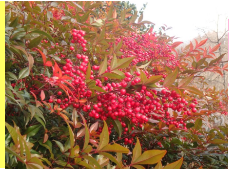
「ナンテン」(アミゼの森)1月7日撮影