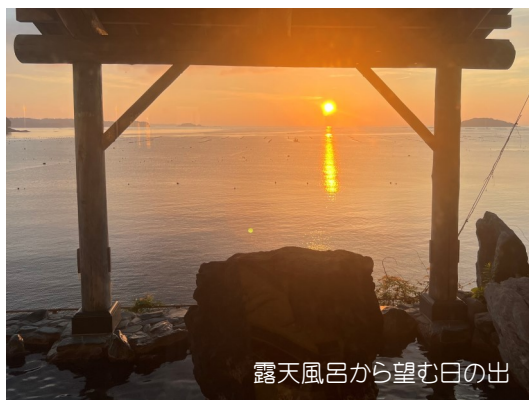
露天風呂から望む日の出

2日間のお風呂の食事も美味しく、郡山信用金庫及び福島交通の関係者の方々に御礼と感謝を申し上げます。