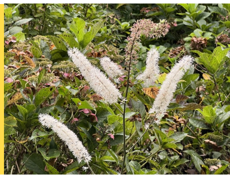
サラシナショウマ (アミゼの森)10月6日撮影