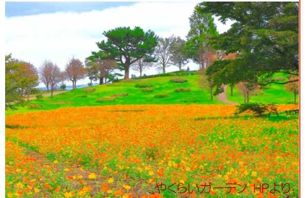
やくらいガーデン HPより