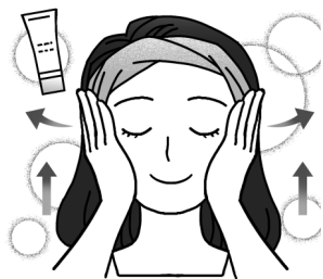
優しく、『内→外』『下→上』へ動かす