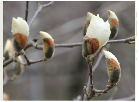
白モクレン (アミゼの森) 4月4日撮影