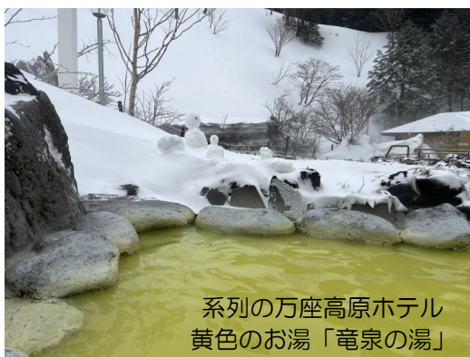
系列の万座高原ホテル 黄色のお湯「竜泉の湯」

ただ、この日は天候が悪く雪が舞い散る冬の嵐、吹雪の中の露天風呂となったが、種類といい、広さといい、湯舟の数といい、最近では味わえなかった大満足の露天風呂探訪となった。ここへ行かれる方は両方の露天風呂にいかれることをおすすめする。