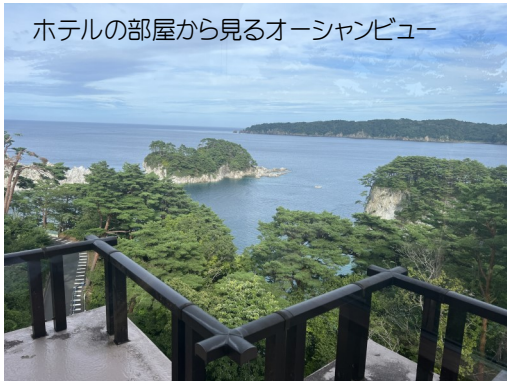
ホテルの部屋から見るオーシャンビュー

今回は岩手県宮古市の「浄土ヶ浜パークホテル」に行くことにした。 距離にして408km、時間にして5時間弱だ。 仙台から三陸道を走り宮古市まで向かったが、整備された道路は、国道45号線になっても、高速道路と変わらない快適な道路状況である。鳴瀬奥松島から北は無料区間である。但し、注意しなければ