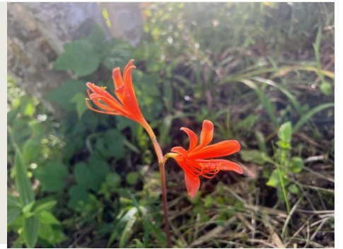
キツネノカミソリ(アミゼの森)8月12日撮影

買い物をしてポイントを貯め、それを使ってまた買い物をする。ポイント集めは、広告を見る、ゲームをプレイする、アンケートに回答するなど、何らかの行為をすることでポイントが貯まり、活用できる「ポイント活」なる言葉も生まれました。