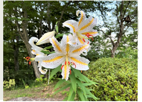
山百合 (アミゼの森)

タイヤのサイズが20インチ以下の電動自転車の中で、最近利用者が増えている注目の乗り物です。現在は運転免許も不要なため、人気の高いアイテムとなっているのですが、今回はそんな電動ミニベロの魅力や活用法について詳しく解説します。